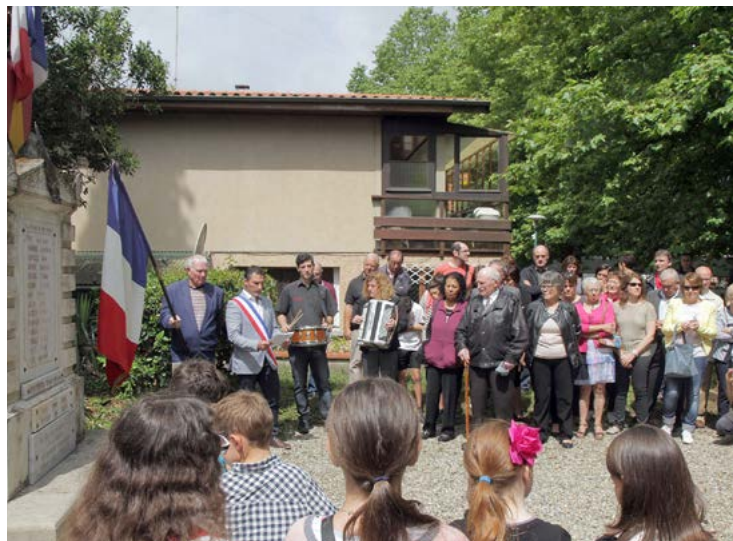
Commémoration au Monument aux morts