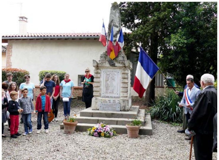
Avec un chant de la section Jeunes