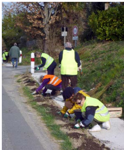
Plantation sur le Piétonnier

Nous essayons au mieux d'entretenir nos voiries communales. Cette année, le chemin du cimetière, le chemin de la marquemale et celui du bois grand ont été concernés.