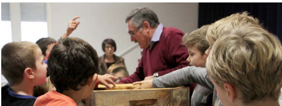
TAPs avec les abeilles