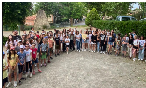
Belle réussite pour les participants à la Soirée JEUNES 2022

Au cours de cet été, 2 concours officiels ont été organisés, le premier début juillet avec une petite trentaine de triplettes mixtes, et le second le 30 juillet avec plus de 60 participants au tête-à-tête du matin, suivi d'une doublette l'après-midi qui a réuni plus d'une cinquantaine d'équipes malgré la canicule. Afin de privilégier l'essor des licenciées féminines dans notre sport, une nouvelle triplète mixte sera organisée le samedi 27 août.