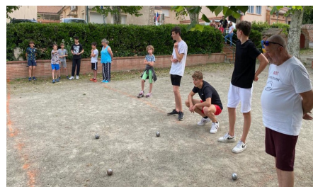
La place d'Aureville animée pour les ateliers de pétanque lors de la Soirée JEUNES 2022

Sous le soleil du samedi 14 mai, la place ombragée du village s'est vue animée par la jeunesse des villages alentours pour la « soirée JEUNES » organisée par les communes d'Aureville, de Clermont-le-Fort et Goyrans afin de faire découvrir et partager cette passion sportive qui nous anime ! Plusieurs ateliers d'entraînement à la pétanque ont été mis en place pour le plus grand plaisir de la cinquantaine de participants, ce fut une belle réussite !