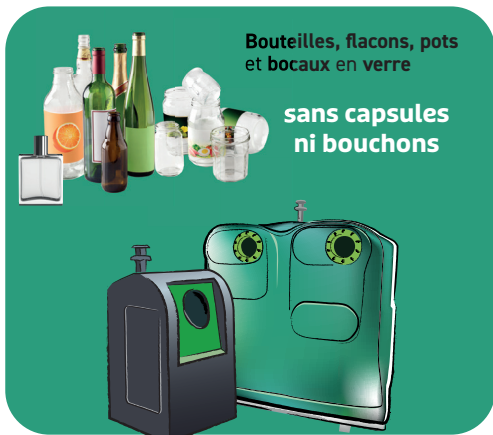
Bouteilles, flacons, pots et bocaux en verre