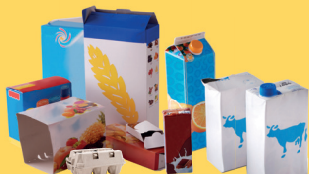
Emballages en carton et briques alimentaires bien vidés et aplatis