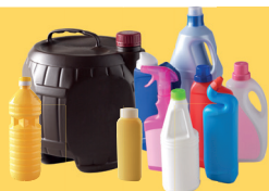
Bouteilles et flacons en plastique, alimentaire et sanitaire