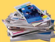
Journaux, catalogues, papiers...