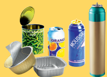
Emballages métalliques, aérosols bien vidés