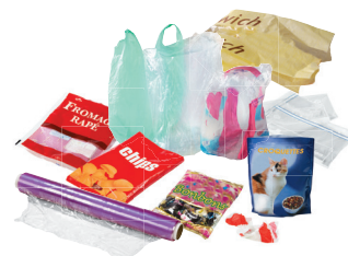
Sachets, pochettes, films plastiques...