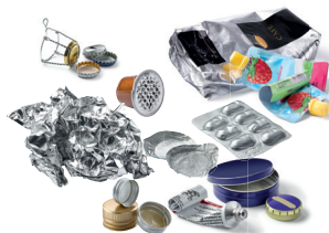
Petits emballages métalliques...