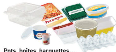
Pots, boîtes, barquettes...